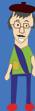
利用者さんが描いてくれました

【理念】人として『当たり前前の暮らし』を支援する 地域や施設で暮らす知的・身体・精神・発達障がいの方が自分らしく 価値ある時間を生きられるように、一人一人に合わせた支援や相談を行う