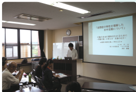
定期的に研修を行っています。