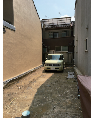
車二台が駐車可能です