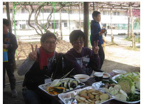
同学年コンビです。

そらいろの利用者さんの参加者は小・中学生のお子さんからアラフォーの方まで年齢層は幅広く来ていただきました。普段は一緒に活動する事が少ないので、このような機会は貴重な時間だと思えました。初対面の方達も多くおられましたがお肉を囲んで、ワイワイとお話する事もできました。