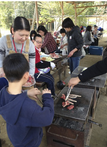
野外で炭火で焼いて食べると美味しいですね。